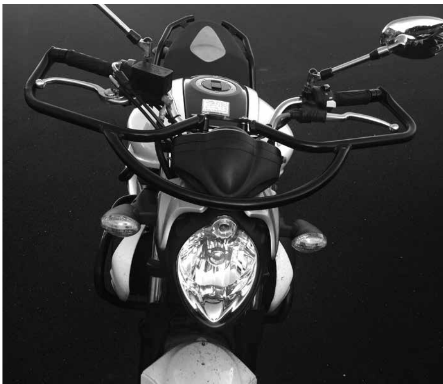
Billede 1: Bredde og håndtag

Kontrol (billede 1): Drej styret til begge sider og se om der er plads til hænderne og ryk godt i gummihåndtagene.