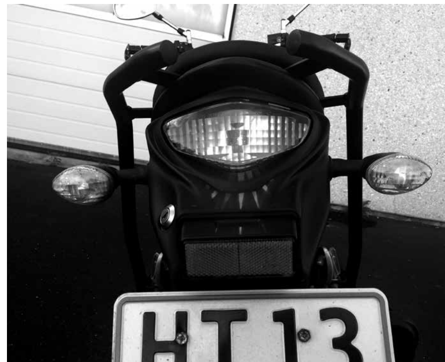
Billede 19: 3,5 x baglyset

Kontrol (billede 19): Træd på fodbremsen og aktiver håndbremsen. Se om bremselyset virker.