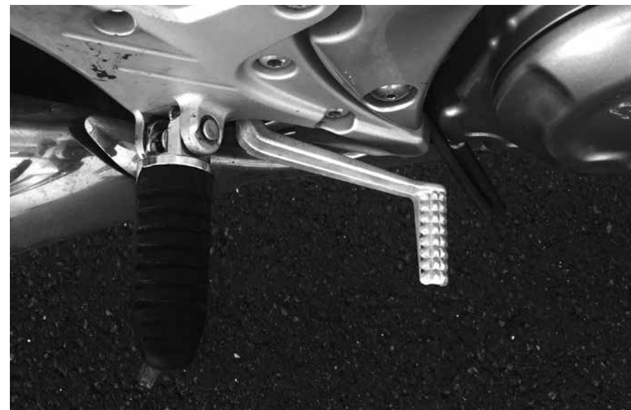
Billede 16: Bremsepedalens vandring

Kontrol (billede 16): Mærk med hånden om der er frigang og tryk derefter pedalen ned med foden. Forklar om frigang, vandring og højden af pedalen.