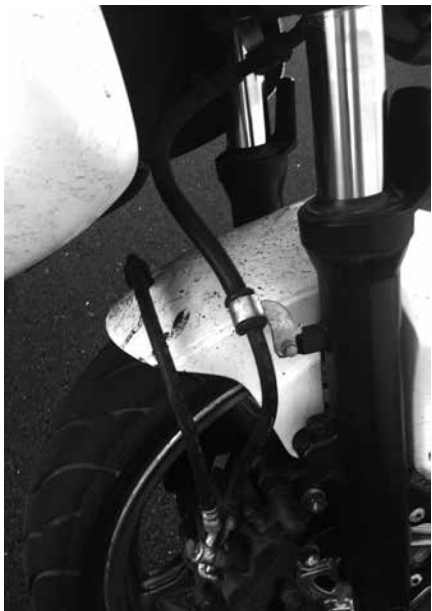
Billede 14: Følg slangen

Kontrol (billede 14): Følg slangen ned til hjulet, se efter utætheder ved banjoboltene der skrues slangen fast til hovedcylinderen og kaliberen ved hjulet. Se efter revner, hvis slangen har været i klemme. Den skal sidde i de bøjler der forhindrer den klemmes.