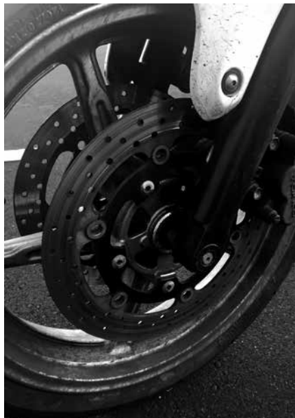
Billede 15: Huller i skiven