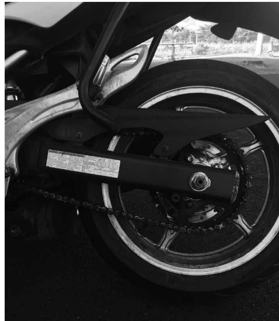
Billede 11: Kædens spillerum 2-4 cm

Kontrol (billede 11): Løft op i kæden på midten og se spillerum. Forklar om baghjulsblokade.