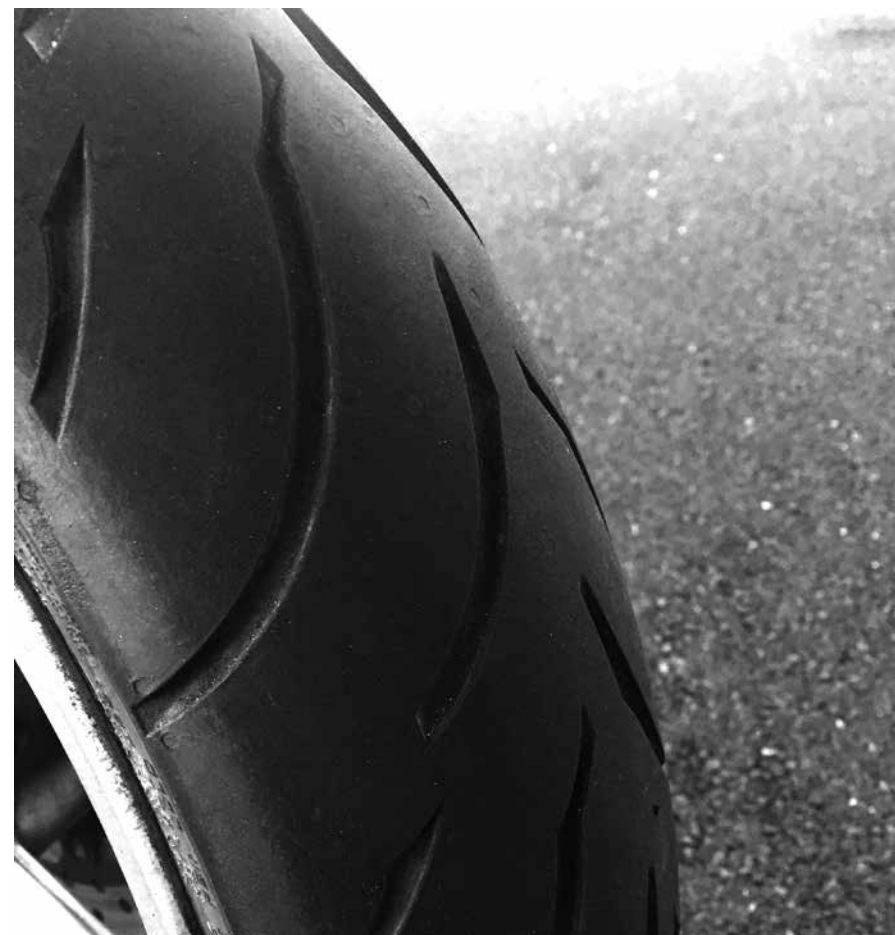
Billede 8: TWT

Kontrol (billede 8): Forklar om kravet til slidbanen og farligheden i beskadigelser på siderne. Find slidgrænseindikatoren ud for mærket "TWT". Se efter en pil på siden. Dæktrykket står ofte på siden af kædeskærmen, men ikke på siden af dækket da det kun er maks.-trykket dækket kan tåle.