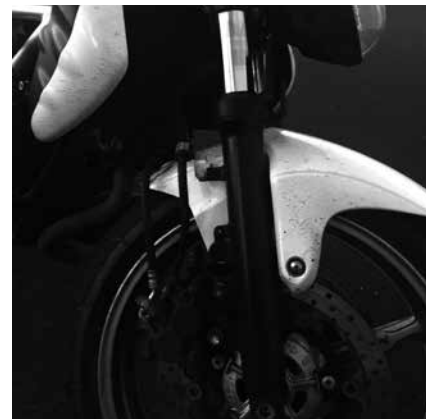
Billede 5: Gliderør

Kontrol (billede 5): Med MC'en på det store centralstøtteben sætter du dig på hug foran MC'en og rykker frem og tilbage gliderørene. Der må ikke mærkes slør. Har MC'en ikke et centralstøtteben kan du bruge sidestøttefoden, men pas på du ikke river den omkuld. Forgafflen må heller ikke udskiftes med en længere som fx en chopper. Styringen bliver ændret og en styrefølsom motorcykel kan pludselig blive meget styretræg og svær at dreje med. Det er efterløbet, der har betydning for selvopretningen.