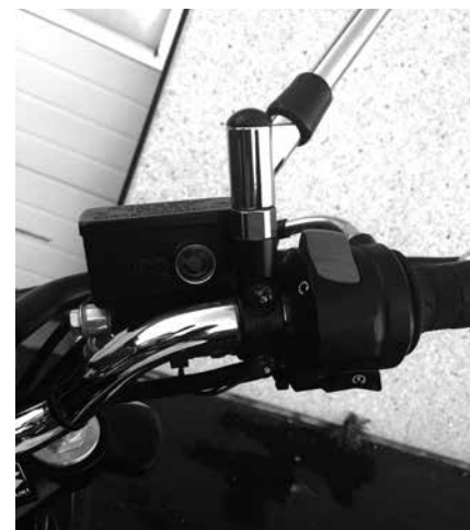
Billede 12: Væskestand

Kontrol (billede 12): Se efter bremsevæske i det lille øje eller ved stregen rundt om beholderen. Der skal være væske op over minimumsmærket. Hvis der mangler væske er der muligvis en utæthed eller at bremseklodserne er nedslidte. Når klodserne bliver tyndere må stemplet bag ved klodserne bevæge sig længere ud, her bliver der så mere plads, så væskestanden i beholderen synker. Slidte klodser giver derfor lav stand.