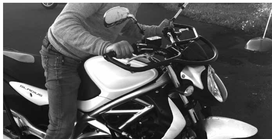
Billede 3: Skub