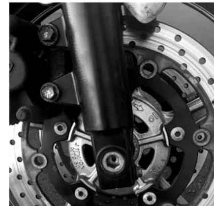
Billede 6: Her 2 sikringsbolte