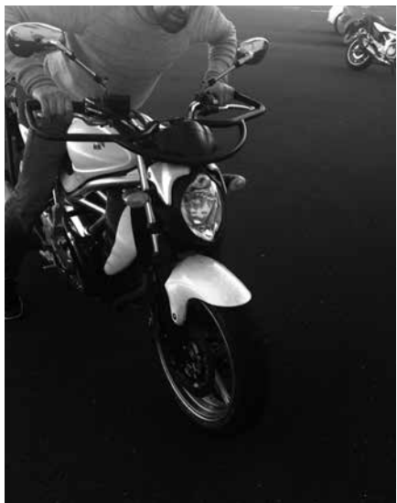
Billede 9: Tryk til!

(Billede 10) Hop i sædet så du presser støddæmperne helt sammen og slip, se om MC'en hopper videre efter du har sluppet. Se efter på ydersiden af dæmperne om de lækker olie.