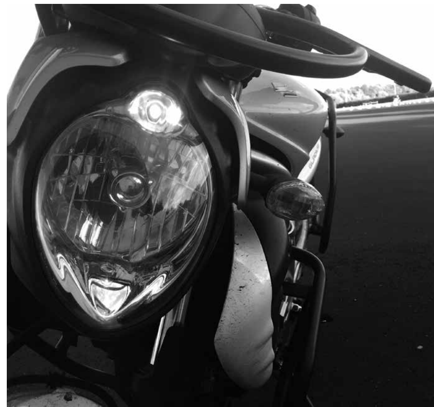
Billede 17: Ses 300 m væk

Kontrol (billede 17): Drej tændingsnøglen over på ON og sæt lyskontakten på første klik. Se efter lys foran, bagpå og på nummerpladen. Nummerpladelyset er også tændt og nummerpladen skal kunne læses fra 20 meters afstand.