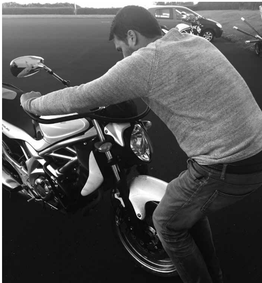
Billede 4: Træk hårdt ind mod dig selv og derefter vrid hjulet ind i gafflen

Kontrol (billede 4): Stå foran MC som før, men klem hårdt om hjulet med knæene mens du drejer styret fra side til side. Gafflen må ikke vakle eller vrides under din vridning af styret.