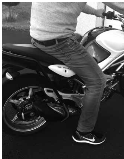
Billede 10: Hop i sædet!