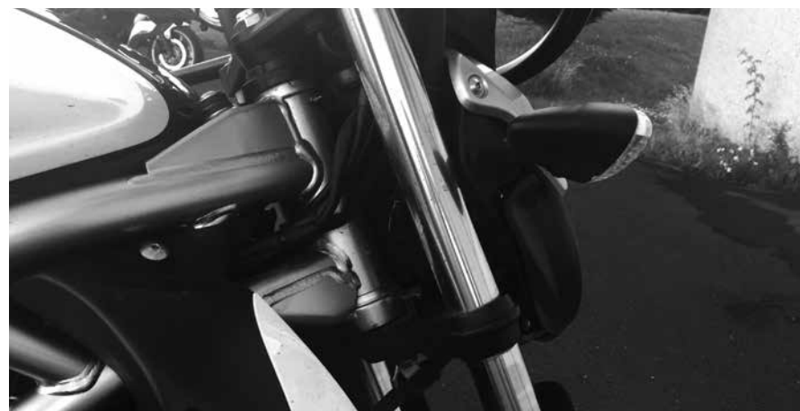
Billede 2: Hvor?

Kontrol (billede 2 & 3): Skub MC'ens forhjul op mod en fast genstand fx en mur. Slør mærkes som et klik i gafflen når man trækker den ind mod muren. Er der ikke en fast genstand kan du stå med front mod MC'en med forhjulet mellem benene og rykke hårdt fremad i styret ind mod dig selv. Der må ikke mærkes slør.