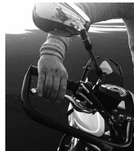
Billede 13: Frigang og vandring på grebet