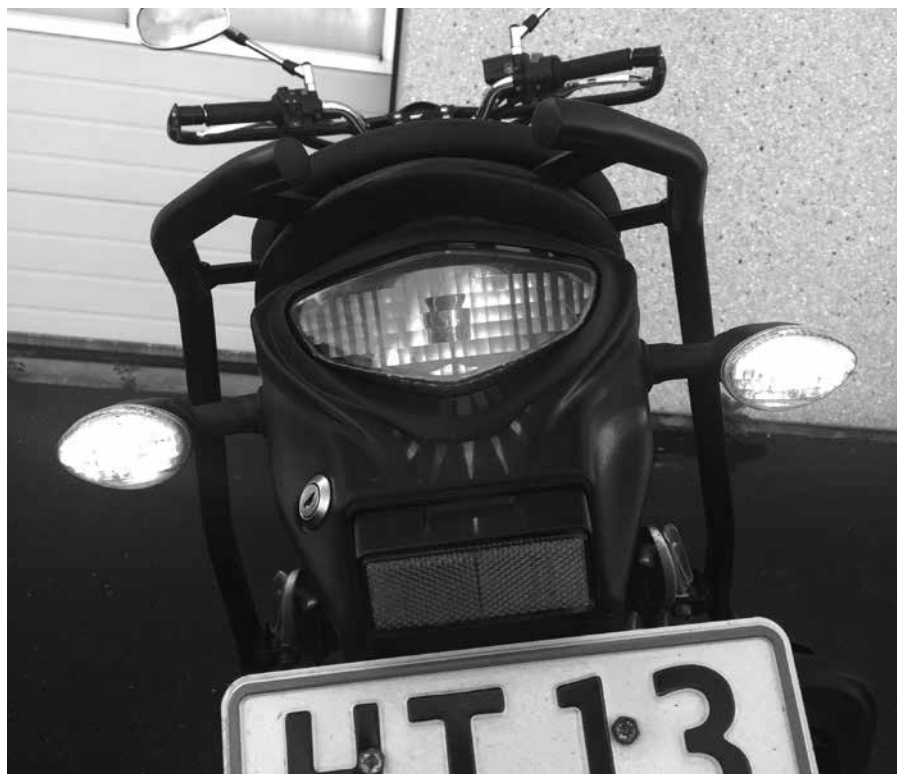
Billede 20: Ses i solskin og 60-120 blink pr. min.

Kontrol (billede 20): Tænd blinklyset til hver side og se at alle blinklygter lyser. Fortæl om lysstyrke og blink pr. minut.