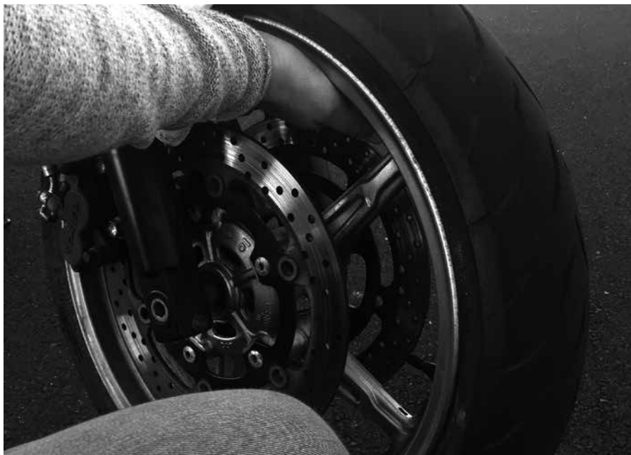
Billede 7: Ryk fra side til side og hold fast i gaslen

Kontrol (billede 7): Tag fat i øverste kant på hjulet ud for gliderøret og ryk fra side til side. Hold evt. igen på forgaslen så du kan rykke til. Der må ikke mærkes slør.